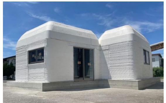
完成した3Dプリンター住宅：セレンディクス社提供

価格も一般的な戸建てに比べるとかなり安いことがわかりますが、それよりも驚くことは、施工期間の短さです。50㎡の1LDK規模の戸建てが、内装や設備工事を除く外観部分だけで約2日間で完成となるようです。また、その際に工事に携わる人員も大幅に削減できることから、人件費を抑えられるため、今後の建築業界が大きく変わっていくことが予測されます。